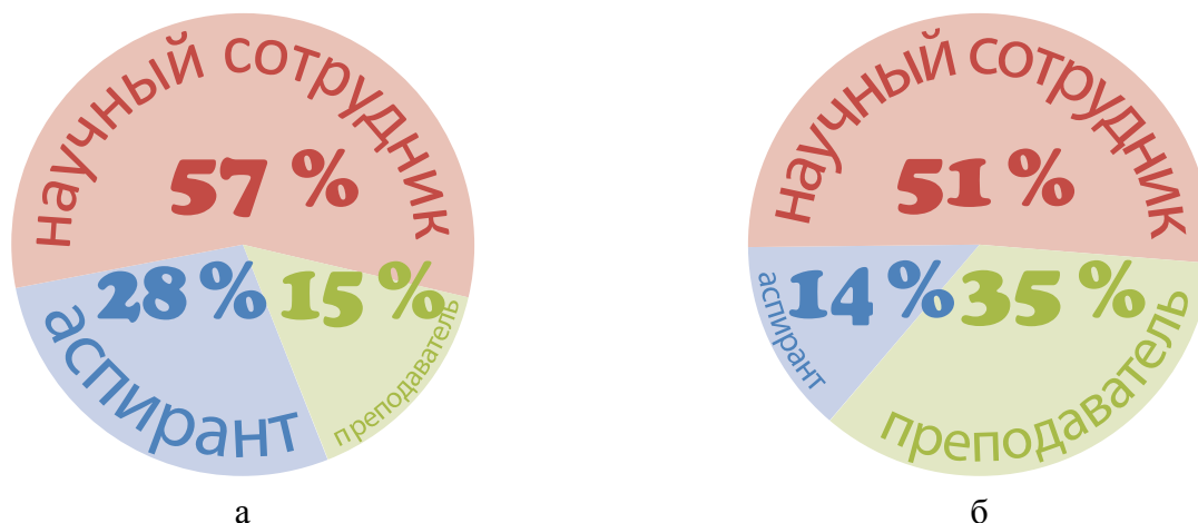
Рис. 1. Соотношение количества аспирантов, научных сотрудников и преподавателей: а) авторы журнала; б) данные Росстата (все исследователи России)

Редакция постоянно ведет диалог с авторами для выявления стоящих перед ними задач. Так, в июле 2020 года по электронной почте проведен опрос о новом сайте, в ходе которого определялась наиболее удобная для решения задач авторов и читателей версия журнала (рис. 2).